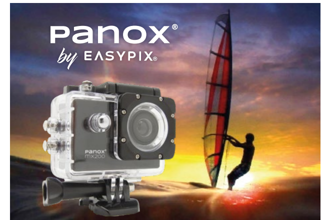
"by EASYPIX" Version

In order to ensure visibility, the logo may only be placed on "quiet" backgrounds. For product catalogues please use the logo version "by EASYPIX".